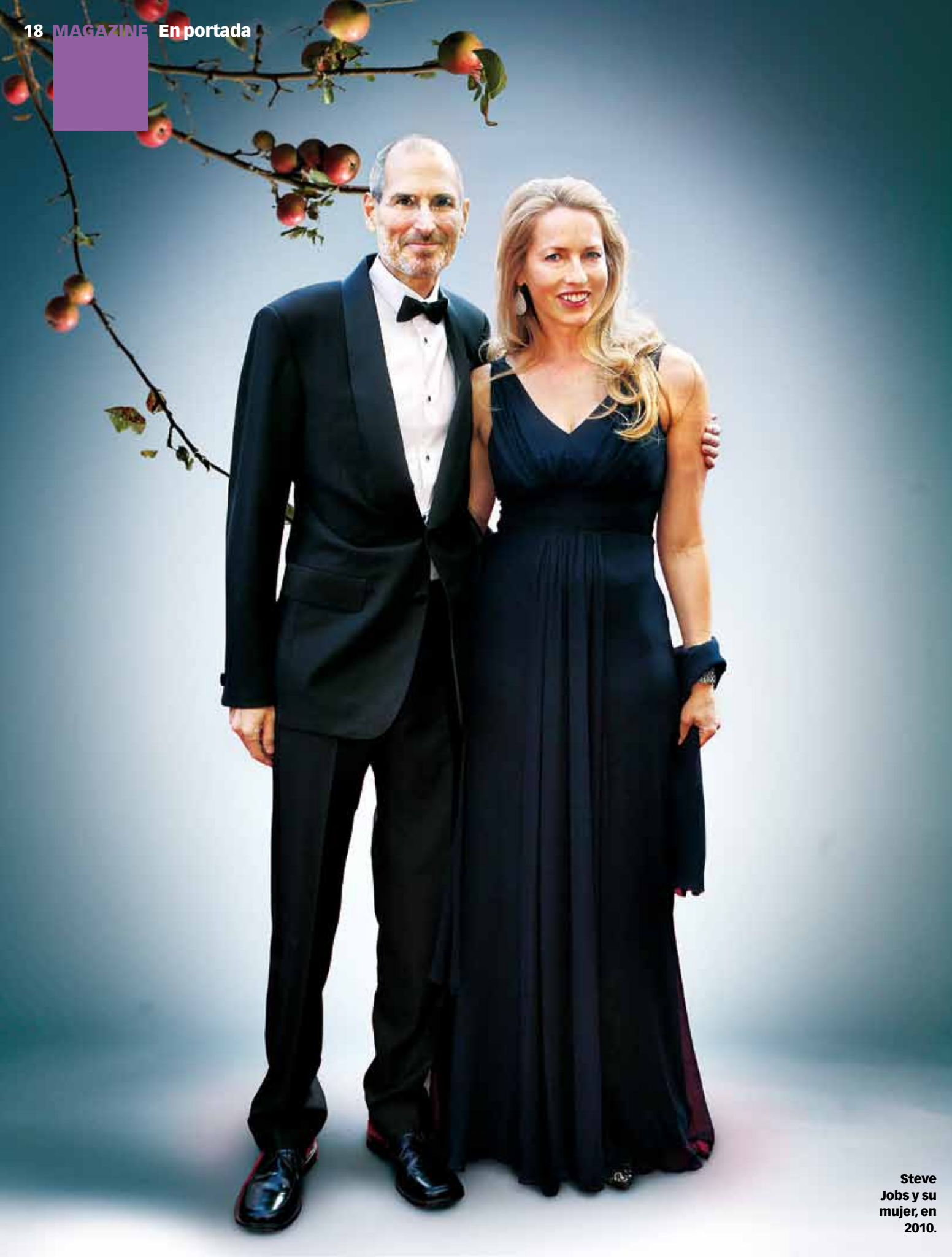
Steve Jobs y su mujer, en 2010.